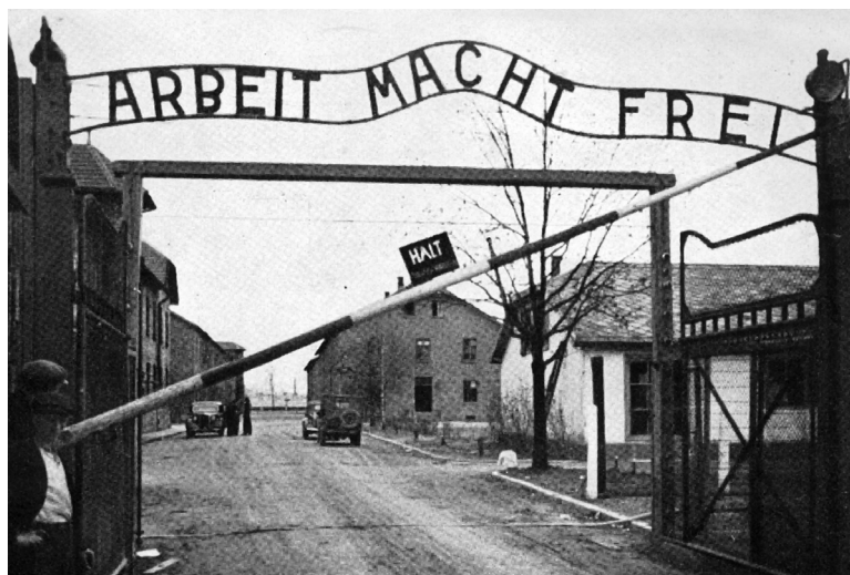
Eingangstor zum Stammlager Auschwitz, durch das morgens die Häftlinge zu ihren jeweiligen Arbeitseinsätzen geführt wurden. Rechts vor dem Ausgang musste das Lagerorchester Marschmusik spielen und die Gefangenen sollten im Gleichschritt marschieren.

abgelieferten Sachen wurden in die Effektenkammer* geschafft, ohne dass die Häftlinge einen Beleg dafür bekamen. »Kanada« wurde dieser Block genannt, wie Wilhelm Brasse im Laufe seiner Haftzeit erfuhr.