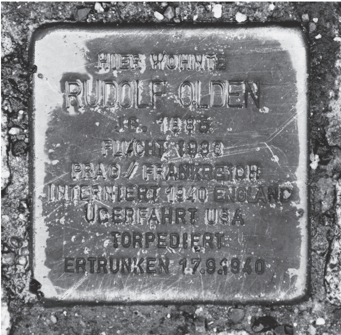
Stolperstein für Rudolf Olden in der Genthiner Str. 8, Berlin