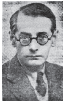
Das letzte Bild von Rudolf Olden